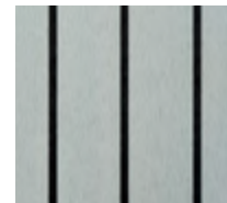
Grau mit schwarzen Fugen (S)