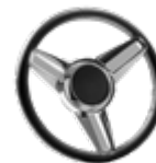
Steuerrad mit italienischem Leder (S)