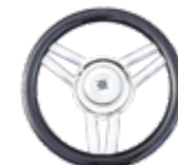
Steuerrad Carbonoptik (S)